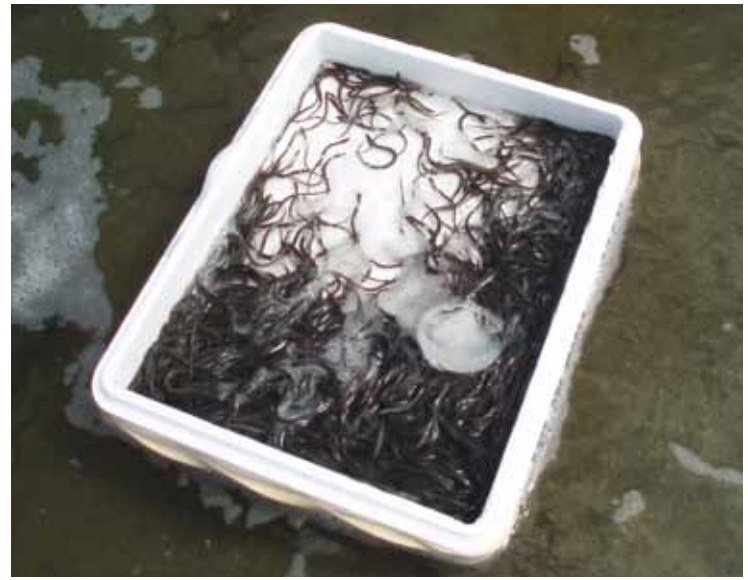
Mycket få ålyngel når de svenska vattendragen under sin vandring från lekområdena.