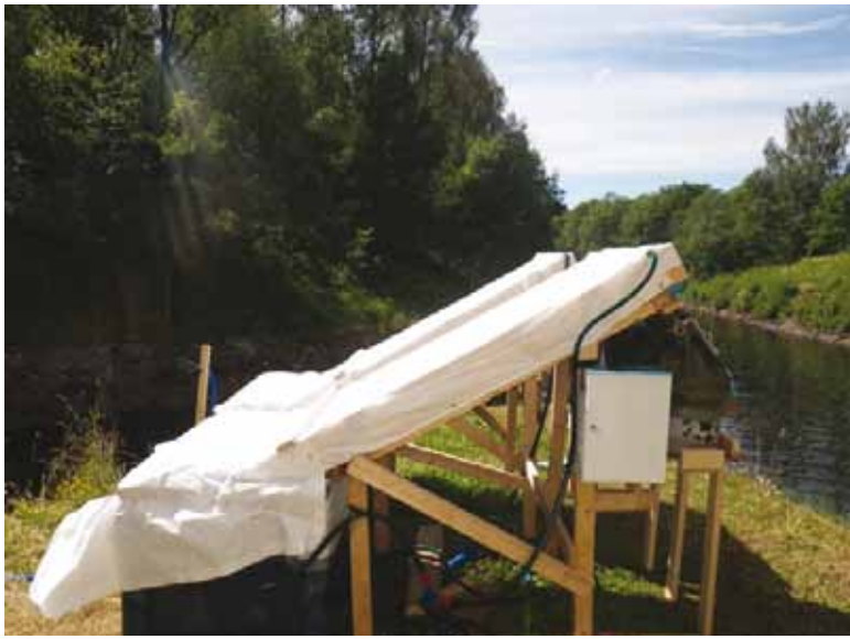
De två testramperna som användes under studien.